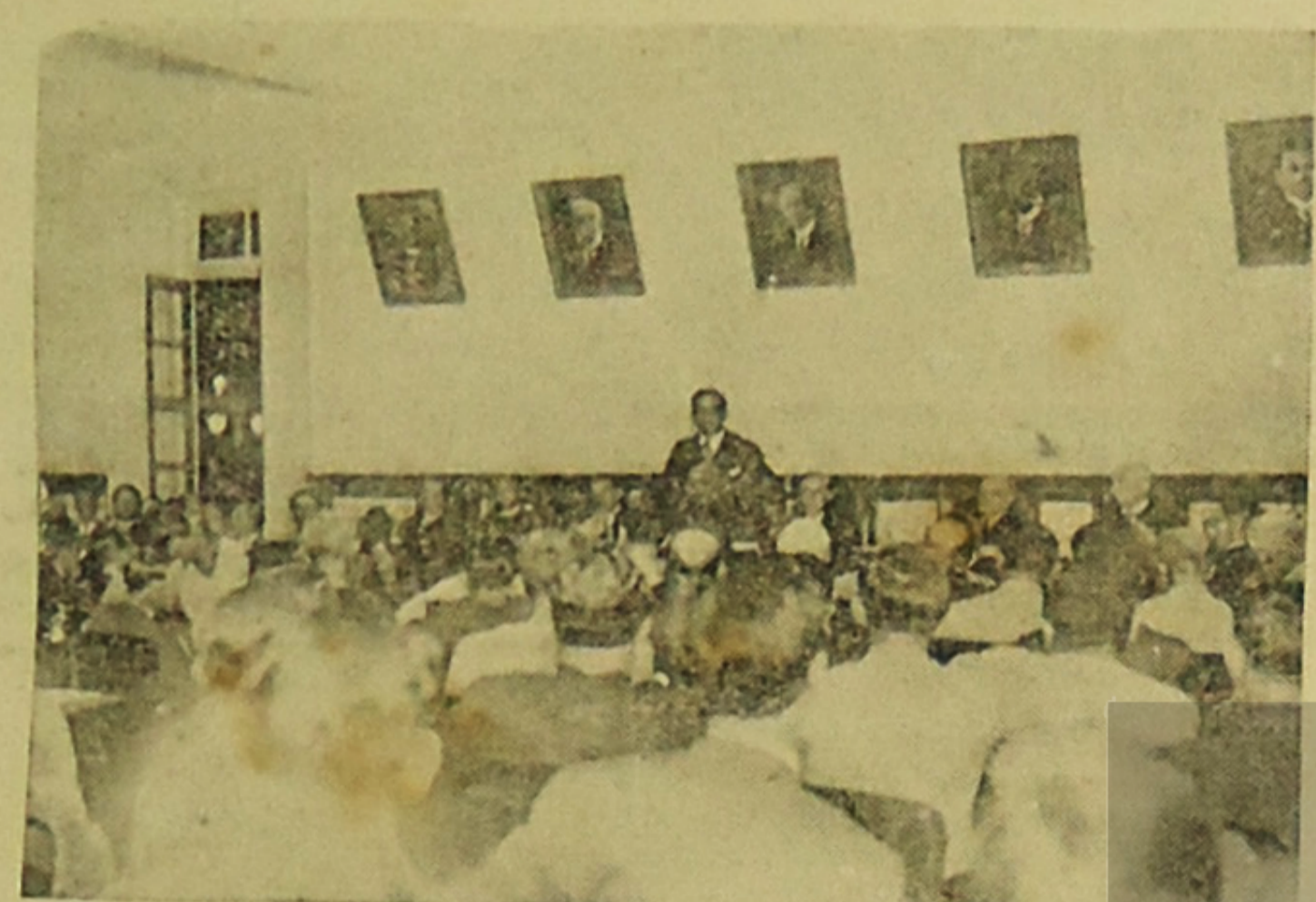
Um flagrante de uma parte da grande assembleia de hontem, vendo-se ao fundo, a mesa de presidencia no momento em que discursava o interventor bahiano