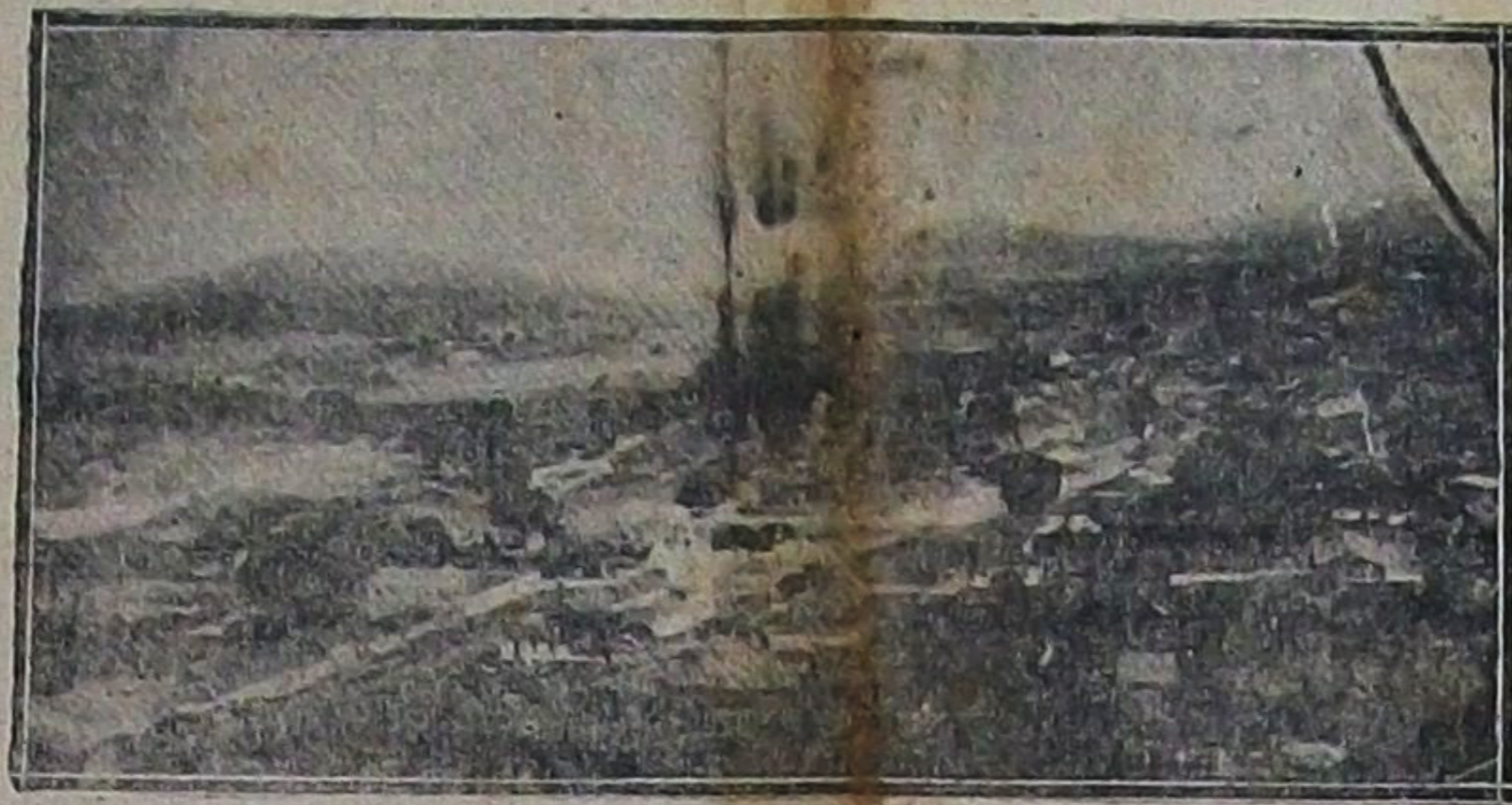
Vista geral de Jacobina

De referencia as terras cedidas pelo Estado ao Governo Federal no Municipio de Jacobina para ser installada a «Estação Experimental de Algodão» o dr. Secretario da Agricultura enviou ao Intendente daquelle Municipio mais o seguinte telegramma «Exmo. Sr. Intendente Municipal de Jacobina. Retiro termos meu telegramma dia 14 solicitando V. Exa. enviar documentos comproba- torios indemnizadores bemfeitorias crece demarcadas «Estação Experi- mental Algodão» alim poder prose- guir com urgencia requerida res- pectivo processo. Alem seu despa-