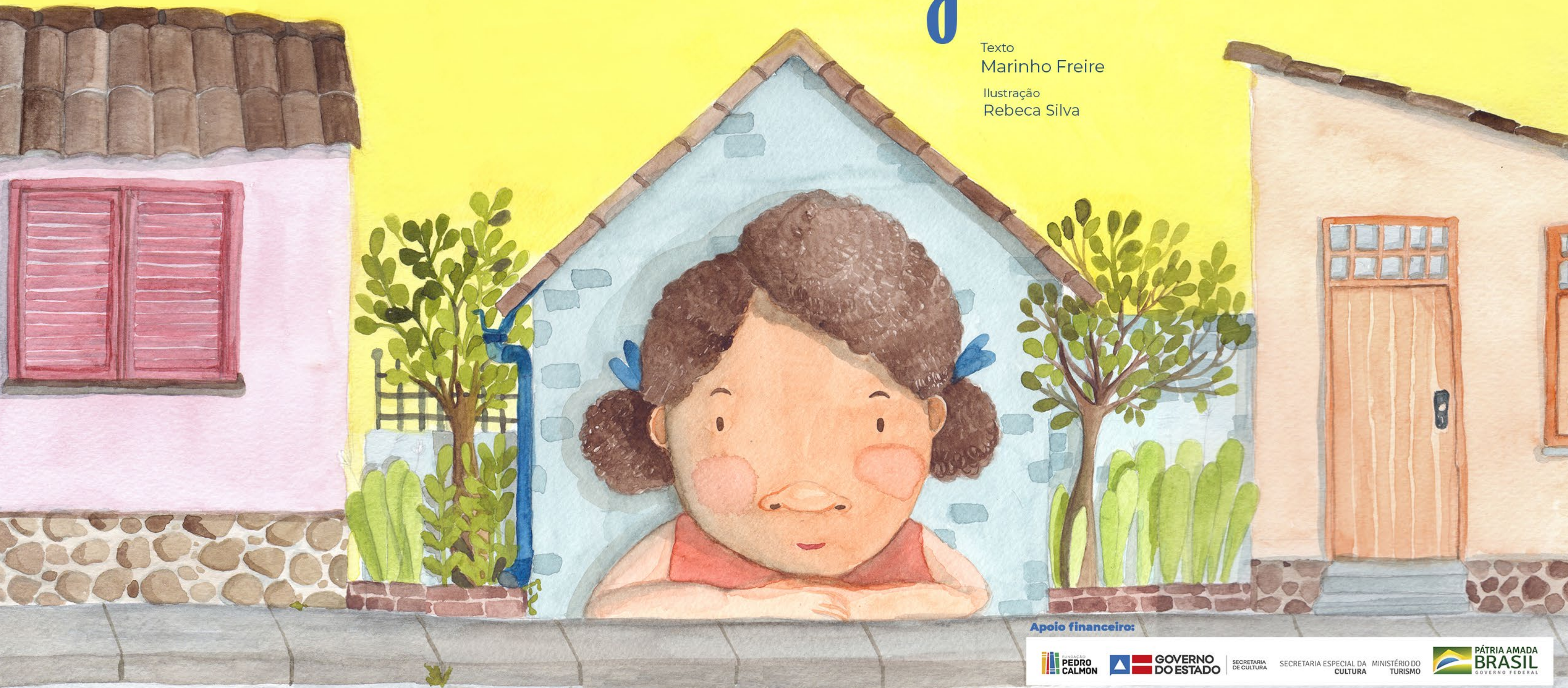
Ilustração Rebeca Silva